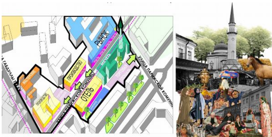
Таблица 7. Концептуальная модель. Современный крытый